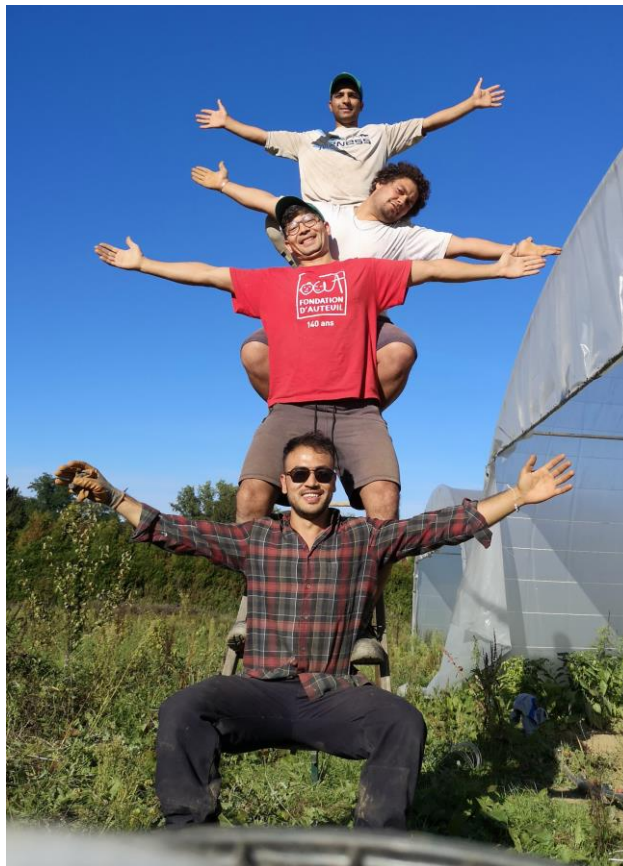
Le Mazet, été 2021 Ensemble, on est plus grands !

Association Loi 1901 Constituée le 25 février 2018 et déclarée à la Préfecture de la Haute-Vienne le 23 avril 2018 N° RNA : W872011666 Siège social : 23, rue du Colonel Ledot - 87400 Saint-Léonard-de-Noblat Site d'activité : lieu-dit Le Mazet - 87590 Saint-Just-le-Martel Contact : laterreenpartage@gmail.com